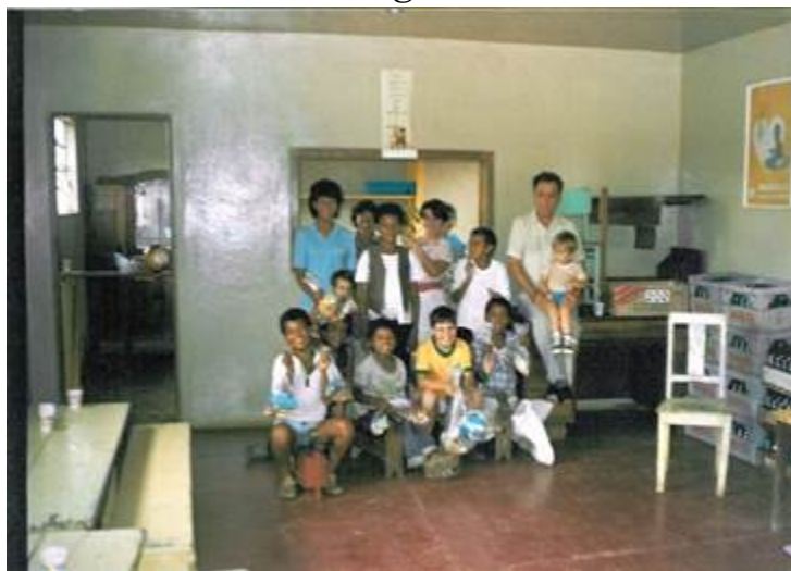
Clube de Mães “Anália Franco” 1985